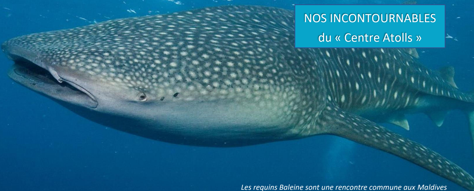
Les requins Baleine sont une rencontre commune aux Maldives