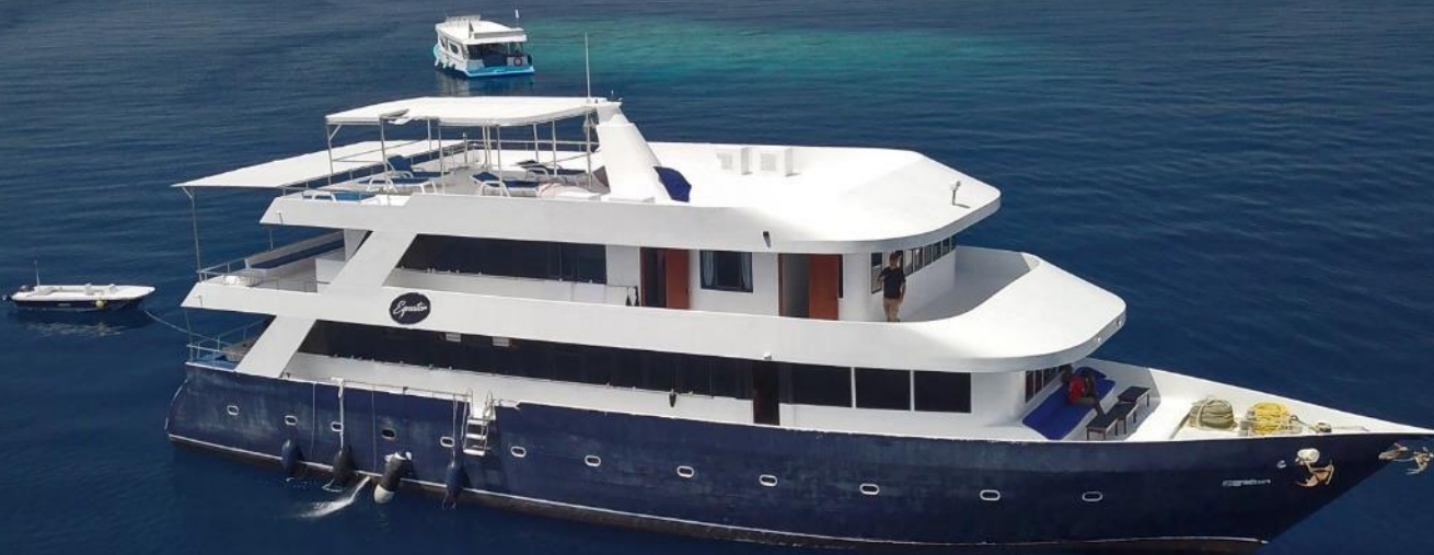
L'Equator, et son dhoni de plongées en arrière-plan